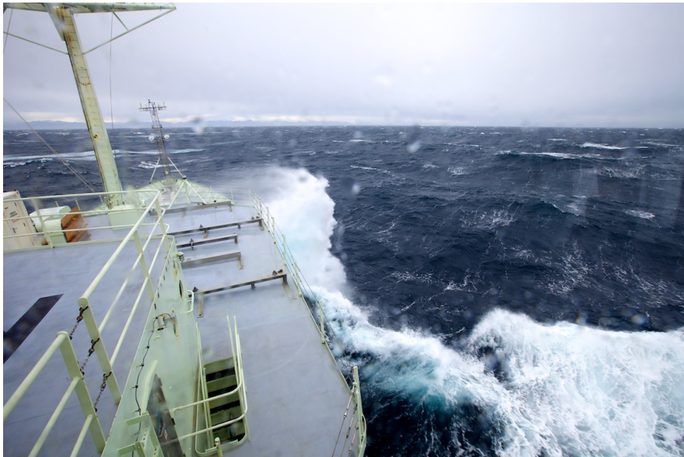
Høy sjø - i bakgrunnen skimtes kysten av Grønland.

Ekspedisjonen er ikke lenger velsignet med nydelig vær - vi opplever nå vind opp mot 53 knop (28 m/s) i kastene, og rundt 37 knop jevnt. Vinden har pisket opp bølger med en høyde på 7-10 meter.