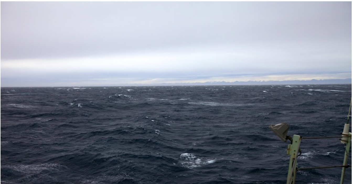
Grønlands taggete kyststripe sees i det fjerne.

Været begynte å bli dårligere i forgårs, fra rolige, slake dønninger til krappe, høye bølger. I løpet av natten ble det verre, før bølgene i dag har stabilisert seg og gir skipet rimelig jevne, om enn store, bevegelser.