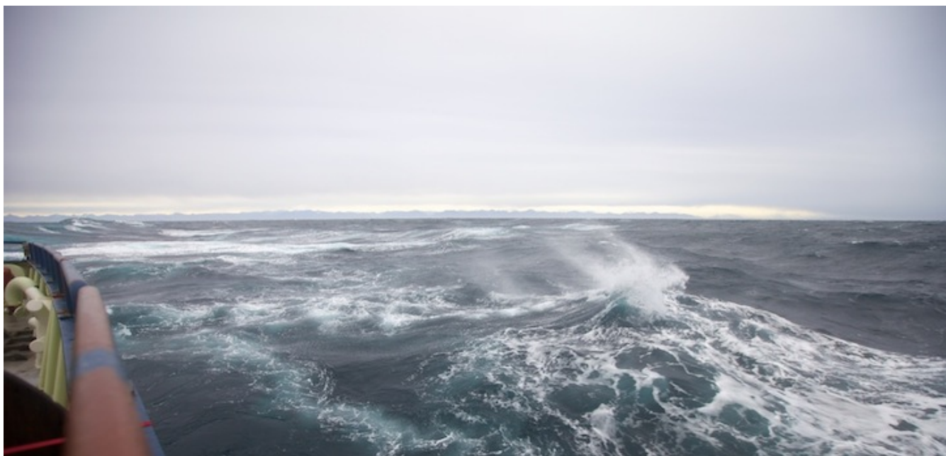
Med line rundt livet og flytedress fikk fotografen en kort tur på akterdekket på «Knorr». Med bølger opp til ti meter, føler man seg fort både liten og ydmyk overfor naturkreftene.

«Knorr» er nå på vei østover, til neste CTD-stasjon, hvor vi skal være fremme om ca 5 timer. Det store samtaleemnet akkurat nå, er hvorvidt man får sove: skipet hugger mot bølgene, tunge stønn går gjennom skroget, og rett som det er rister det kraftig.