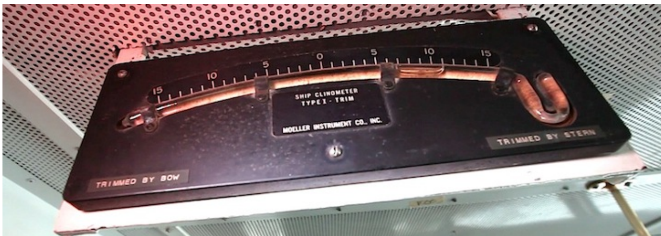
Baugen løftes ti grader fra horisontalen av de største bølgene.

er bevegelsen hvor baugen på skipet løfter seg. Skipet stamper opp til 10 grader fremover, og like mye bakover. I skrivende stund ruller vi omtrent det samme, så alt av utstyr må surres godt fast.